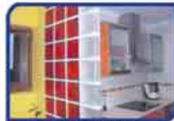
Trabajos en pavés

REFORME SU CASA CON GARANTÍAS Y SIN PROBLEMAS