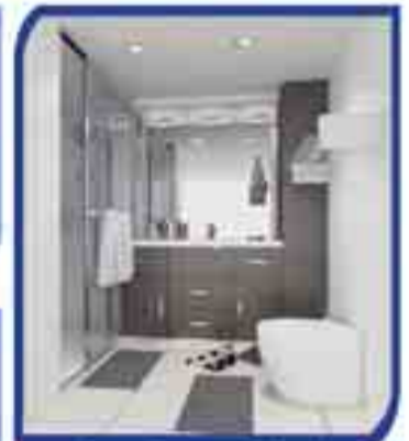
Parquet y carpintería