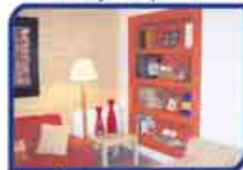
Pladur en general