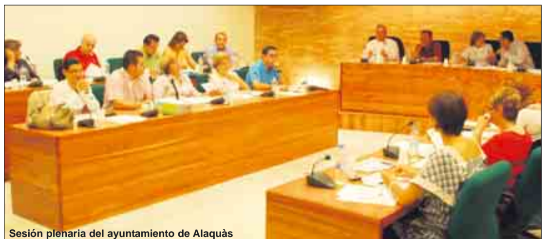
Sesión plenaria del ayuntamiento de Alaquàs

Los residentes del barrio de Alaquàs que alberga el parque de las calles Rafael Alberti y Xirivella ya han recogido más de 200 firmas con las que quieren reclamar al ayuntamiento de Alaquàs una actuación efectiva que erradique la plaga de ratas que padecen en la zona y que afecta su día a día. es un intento desesperado para que el consis-