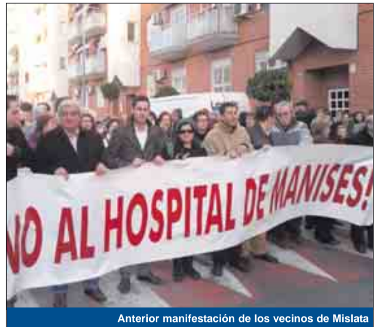
Anterior manifestación de los vecinos de Mislata

En rueda de prensa, Carlos Fernández Bielsa se refirió a la reunión mantenida con el conseller, un encuentro que discursó con 'buenas palabras y buenos propósitos, pero sin compromisos', y eso que Bielsa está respaldado por los grupos en la oposición a través de un acuerdo plenario en el que los tres grupos políticos coinciden en que la adscripción de Mislata al área de